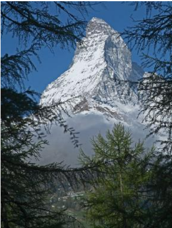
CO 2 weltweit, total

Wenn wir uns vorstellen, dass die gesamten globalen Kohlendioxidemissionen gleichbedeutend mit der Höhe des Matterhorns (rund 4'500 Meter) wären, so würde der von den Menschen weltweit verursachte CO 2 -Ausstoss dem in Basel von Roche geplanten 160 Meter hohen Büroturm entsprechen. Von diesem Büroturm würde der Anteil der Schweiz die Grösse eines „Melchstuhls“ (30 Zentimeter) einnehmen und jener des hiesigen Strassenverkehrs die Höhe eines Halbschuhs (10 Zentimeter) ausmachen.